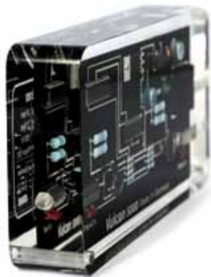
Langlíf akril gler

Vulcan verndar lagnakerfið gegn óæskilegeri uppsöfnun á steinefnum og kemur í veg fyrir innri tæringu.